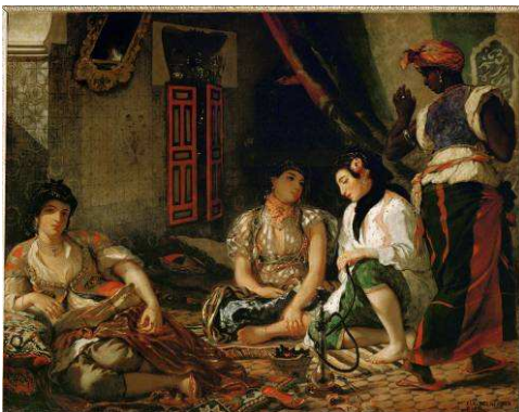
Femmes d'Alger dans leur appartement , 1834. Musée du Louvre

Delacroix (1798-1863) rassemble plus de 130 œuvres, qui montrent les multiples facettes du maître. CaixaForum Madrid accueille des tableaux qui comptent parmi les plus célèbres du peintre, comme La Grèce expirant sur les ruines de Missolonghi , l'une des esquisses de la Mort de Sardanapale ou encore Femmes d'Alger dans leur appartement , exceptionnellement prêté à