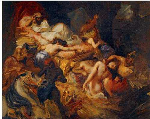
Esquisse de la Mort de Sardanapale, 1826-1827 Musée du Louvre

Le choix des œuvres exposées – qui cherchent à donner une nouvelle interprétation du « romantisme » – a été guidé par le plaisir visuel et par la rigueur intellectuelle. Après la réédition du Journal de Delacroix en 2009, cette rétrospective propose une nouvelle vision de la production de l'artiste, fondée sur les dernières découvertes et sur des publications scientifiques.